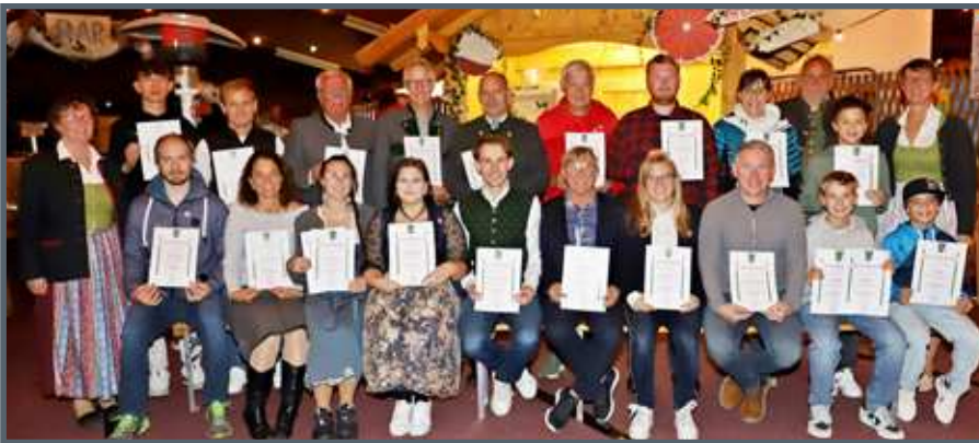
Im Rahmen des FML-Volksfestes in der Union Sportschützenhalle Anfang Oktober fand auch die diesjährige Sportlerehrung statt. Wir gratulieren sehr herzlich!

führt, um die Widerstandsfähigkeit gegenüber extremen Wetterbedingungen wie Überschwemmungen, Hitzewellen oder Stürmen zu erhöhen.